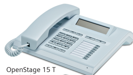
OpenStage 15 T Eis-Blau