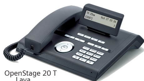
OpenStage 20 T Lava