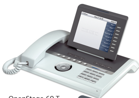
OpenStage 60 T Eis-Blau