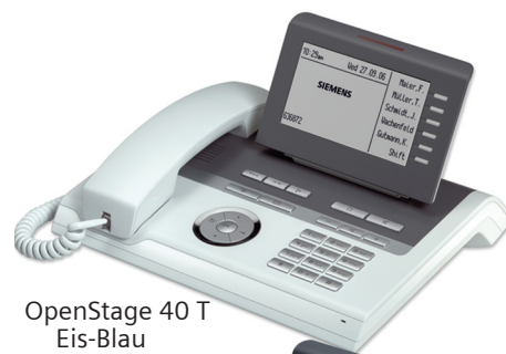
OpenStage 40 T Eis-Blau