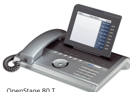
OpenStage 80 T