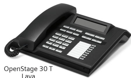
OpenStage 30 T Lava