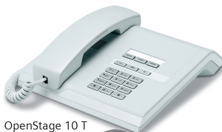
OpenStage 10 T Eis-Blau