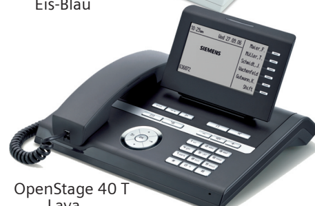
OpenStage 40 T Lava