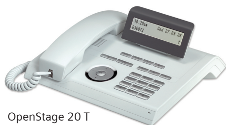
OpenStage 20 T Eis-Blau