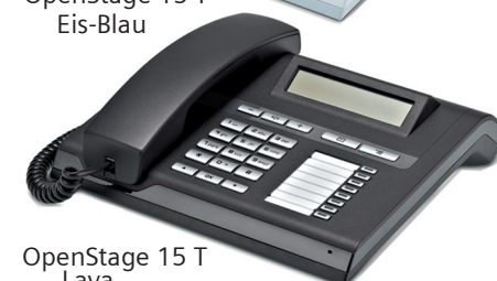
OpenStage 15 T Lava