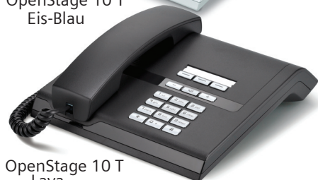
OpenStage 10 T Lava