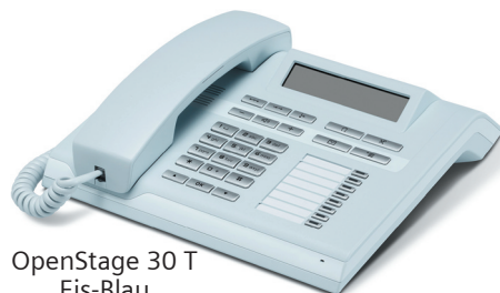
OpenStage 30 T Eis-Blau